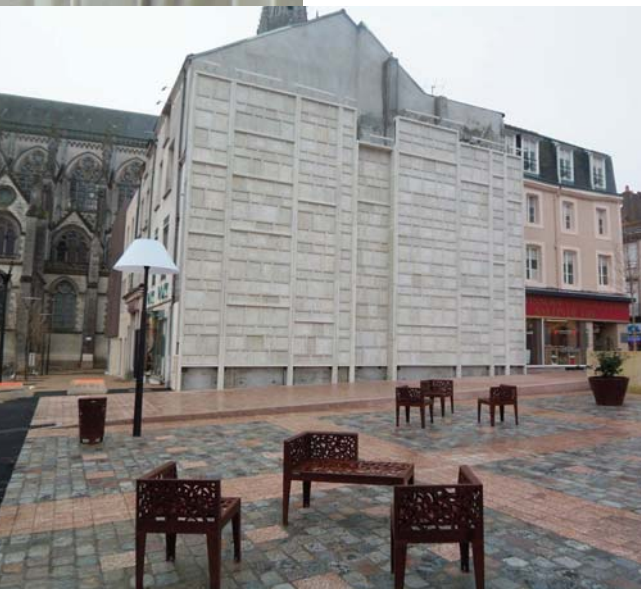
Doc. Ciments Calcia / Cabinet Labaut Architectes associés

Le ciment retenu est un ciment blanc CEM I 52,5 N CE CP2 NF "SB" de l'usine Ciments Calcia de Cruas, particulièrement recommandé pour les parements architectoniques et la maçonnerie d'art, et très légèrement teinté en jaune pour se rapprocher de la couleur de la pierre naturelle.