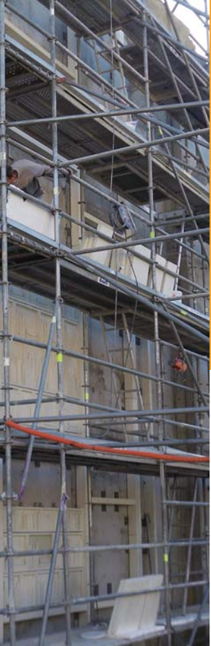
doc. Ciments Calcia / Cabinet Labatut Architectes associés