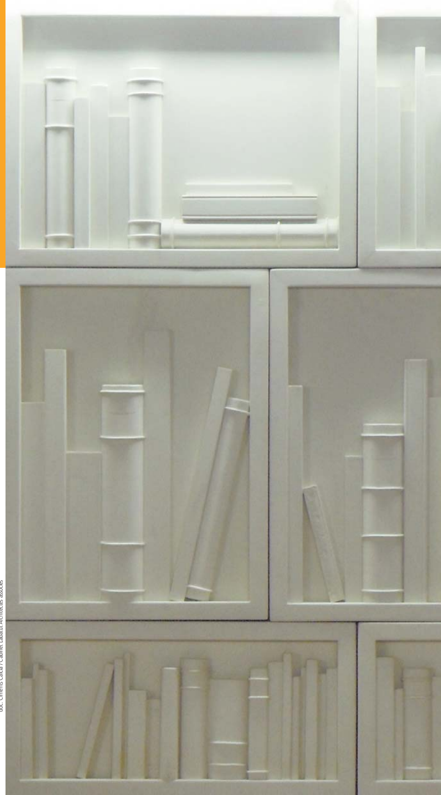
doc. Ciments Calcia / Cabinet Labatut Architectes associés

Chez Novadal-Privat, le travail en laboratoire a été primordial pour le choix des ciment, granulats et adjuvants : trouver la formulation spécifique à même d'apporter la solidité et l'esthétique souhaitées sur une surface verticale de 135 m 2 .